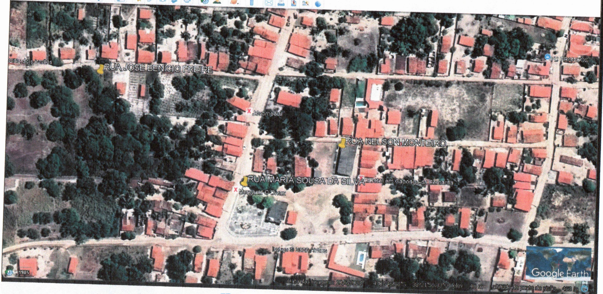
Imagem © 2025 Airbus

Data das Imagens: 10/07/2023 4°02'46.758"S 38°21'56.331"E elev: 49 m altitude do ponto de visão: 400 m